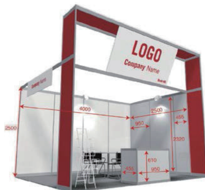
以 12 平米双开口为例